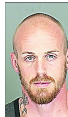
Resguardo en el que la víctima pide ayuda y su novio, el autor del secuestro